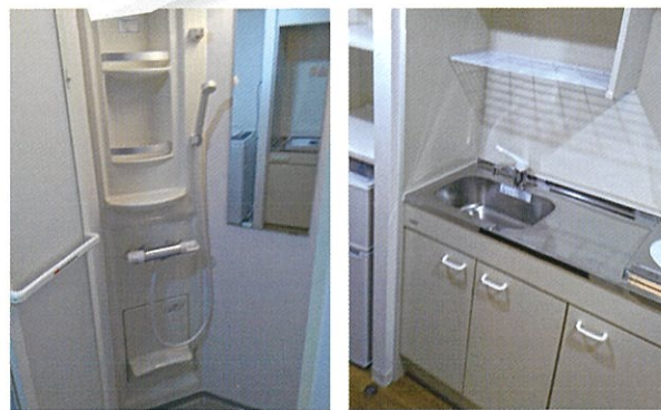
シャワーユニット