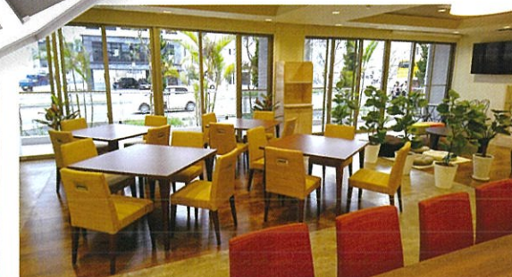
ダイニングルーム

居室設備 机・イス・ベッド・エアコン・冷蔵庫・収納棚・洗濯機・IP電話・電気スタンド 照明・クローゼット・カーテン・ミニキッチン・シャワーユニット・トイレ・シューズボックス インターネット24時間つなぎ放題(Wi-Fi 環境有り)